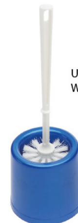
UTIL PORTASCPINO WC ECONOMICO