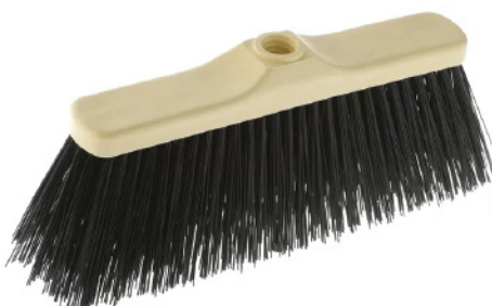
UTIL SCOPA INDUSTRIALE