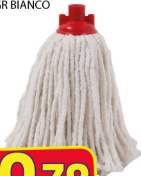
UTIL MOP COTONE 120 GR BIANCO