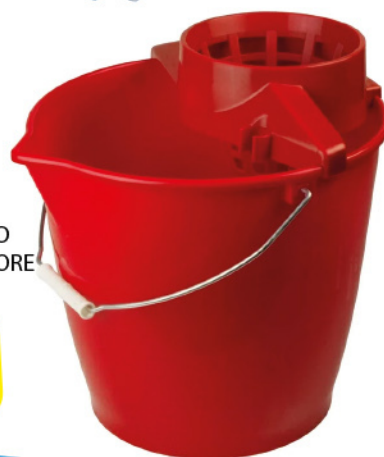
UTILPLASTIC SECCHIO LT. 12 CON STRIZZATORE PP. C. BECCO