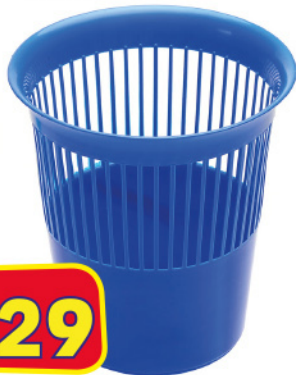
UTIL CESTINO GETTA-CARTA APERTO