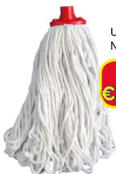
UTIL MOP FILO CONTINUO GR. 200