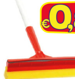
UTIL LAVAVETRO C.M. PLASTICA