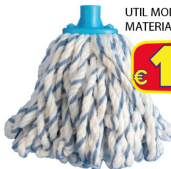
UTIL MOP GR.160 BI MATERIAL