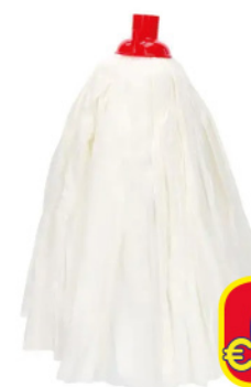
UTIL MOP 160 GR ECOLOGICO