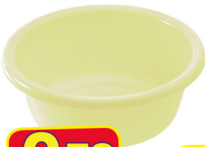
UTIL CATINO CM. 28 LT. 4