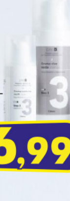
COTONEVE CREMA VISO 50 ML NOTTE SKINCARE