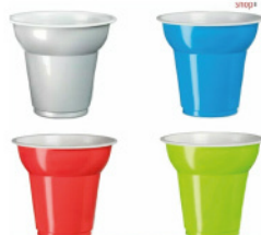
RIFRA BICCHIERI CAFFE' 75 ML VARI COLORI