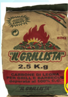
CARBONE GRILLISTA SACCO ORIGINALE