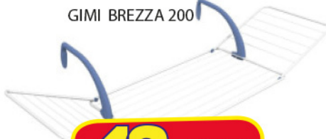
GIMI BREZZA 200