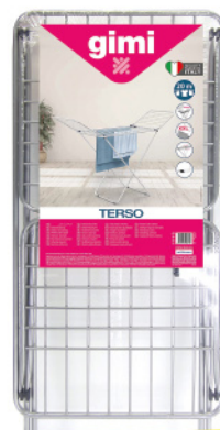
GIMI TERSO SCA 6 PZ