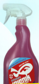
SUTERA SGRASSATORE 750 ML ANTICALCARE/IGIENE BAGNO/ IGIENE CUCINA/MULTIUSO