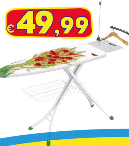
GIMI ARGO ROSSO