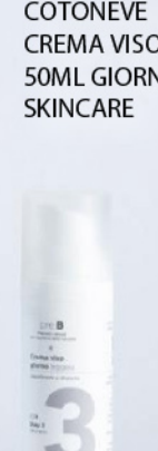
COTONEVE CREMA VISO 50ML GIORNO SKINCARE