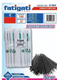
FATIGATI CANNUCCE BIBITA BIO NERE 50 PZ