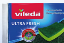
VILED A SPUGNE PIATTI ULTRA FRESH 2+1