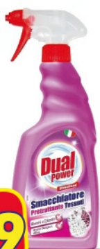
DUAL POWER SPRAY 500 ML SMACCHIATORE TES