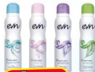
EVIN DEOD. DONNA 150 ML