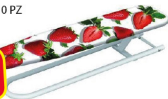
GIMI PLANET 10 PZ