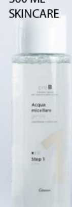
COTONEVE ACQUA MIC. 300 ML SKINCARE