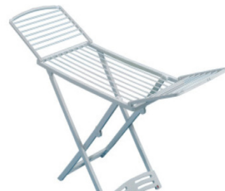
GIMI STENDI ZAFFIRO