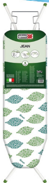
GIMI ASSE DA STIRO JEAN ITALY 114X33 CM