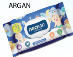
NEOSAN SALV. BABY 72 PZ TALCO/ ARGAN