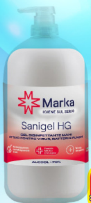
MARKA GEL DISINFETTANTE LT 1