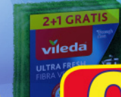
VILED A ULTRA FRESH FIBRA VERDE