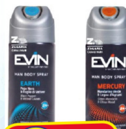
EVIN DEOD. UOMO 150 ML