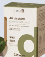
COTONEVE DISCH. 40 PZ SPIRUL. AC. IALUR./ ROSA CANINA