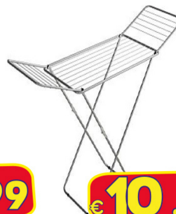
GIMI STENDINO ACCIAIO JOLLY SILVER