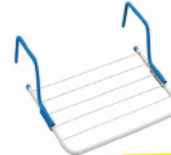
GIMI QUICK SCA