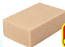
EASYBRILL SPUGNA AUTO 3