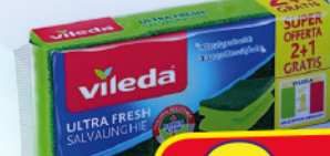
VILED A SPUGNE PIATTI X3 SALVADITA ULTRA