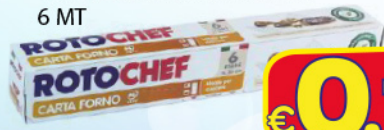
ROTOFRESH CARTA FORNO 6 MT