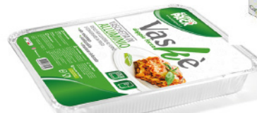
SUPER PACK CONT. ALLUM.12 PORZ. BORDO G S/COP 1PZ