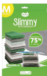
DEALO BUSTA SALVASPAZIO 50X60