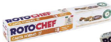
ROTOFRESH CARTA FORNO 6 MT