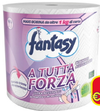
FANTASY BOBINA TUTTAFORZA 1 KG