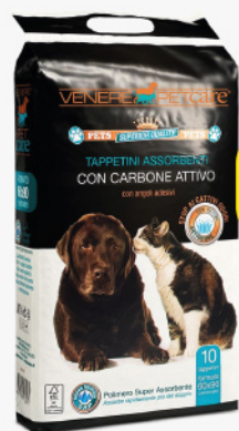
DERMA COTONE TAPP. ANIM. 60X90 CARBONE ATT.