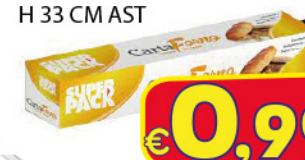
SUPER PACK ROTOLO CARTA FORNO L 12 MT H 33 CM AST