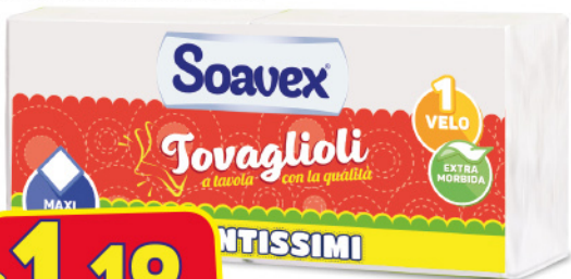
SOAVEX TOVAGLIOLI 33X30 170 PZ TANTISSIMI