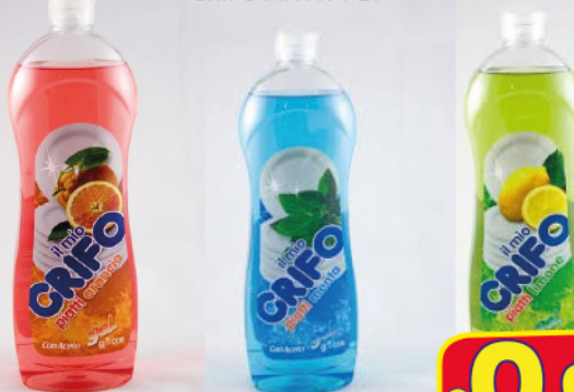
GRIFO PIATTI 1 LT