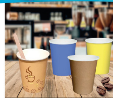
RIFRA BICCHIERI CAFFÈ' 75 ML VARI COLORI