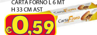
SUPER PACK ROTOLO CARTA FORNO L 6 MT H 33 CM AST