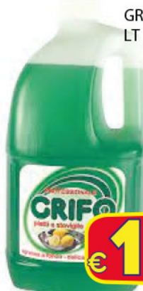
GRIFO PIATTI 3 LT LIMONE