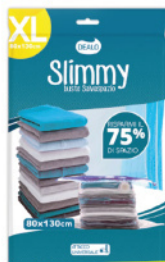
DEALO BUSTA SALVASPAZIO 80X130