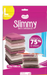
DEALO BUSTA SALVASPAZIO 68X98