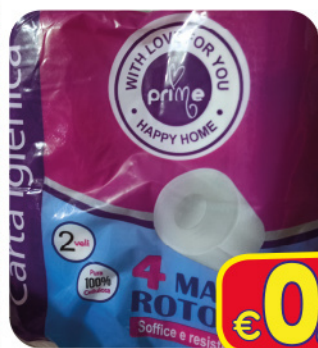
PRIME CARTA IGIENICA 4 ROT 2 VELI