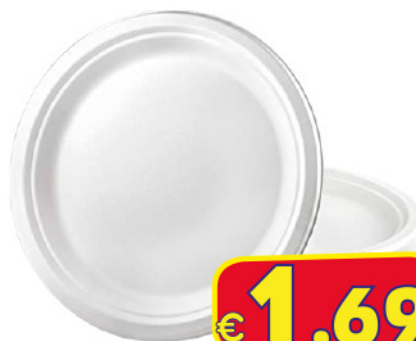
PRESTO PIATTI FONDI / PIANI PZ 25 RIUTILIZZ.