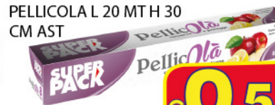
SUPER PACK ROTOLO PELLICOLA L 20 MT H 30 CM AST