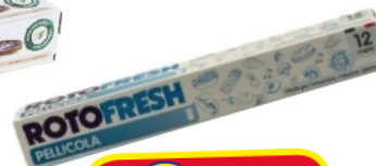
ROTOFRESH PELLICOLA MT 12