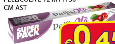
SUPER PACK ROTOLO PELLICOLA L 12 MT H 30 CM AST