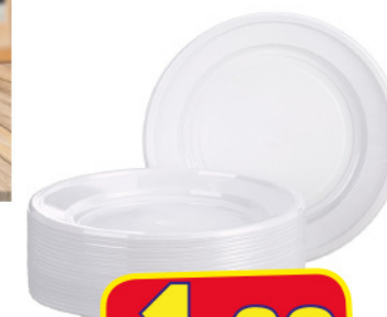
PRIME PIATTI FONDI PP BIANCHI 20 PZ 220MM